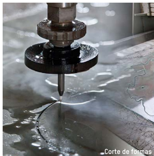
Corte de formas

A prueba de incendio BS 476: Parte 22:1987 y BS EN 1363-1