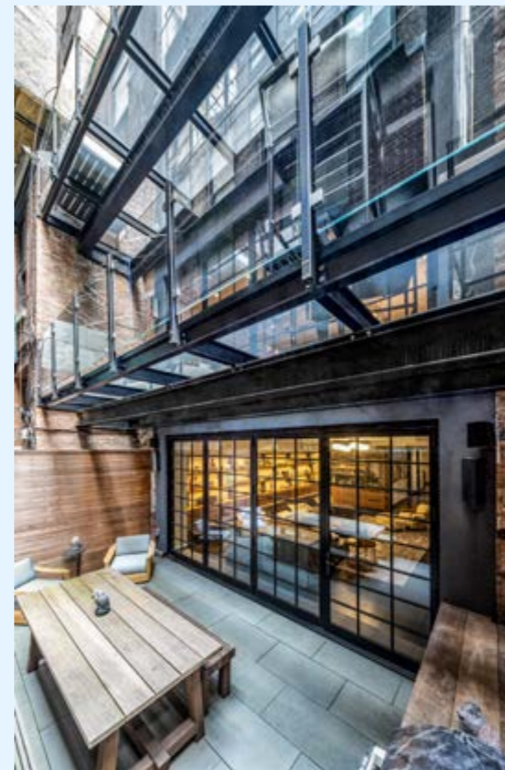
Aplicación Micropunto para residencial.

Partiendo del diseño del cliente y con la posibilidad de retroiluminación tipo LED , la tecnología innovadora Micropuntos utilizada por Control Glass abre posibilidades completamente nuevas en la arquitectura y el diseño de interiores y exteriores. MICROPUNTO LEDS : casi totalmente transparente sin iluminación y ofrece efectos increíbles cuando está iluminado.